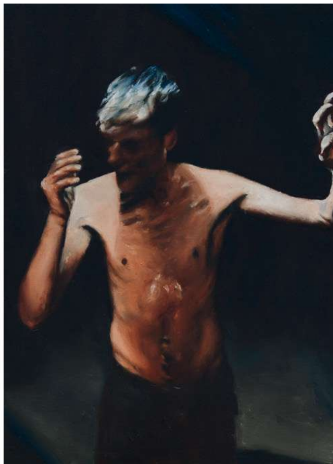
Andrea Pelizzaro , Portraits of a drunk boy , 2021, olio su tela, cm 35x25 cad.